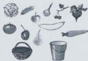
Тіл дамыту жаттығуы

Психологиялық ойын: Ойын: «Атомдар мен молекулалар»